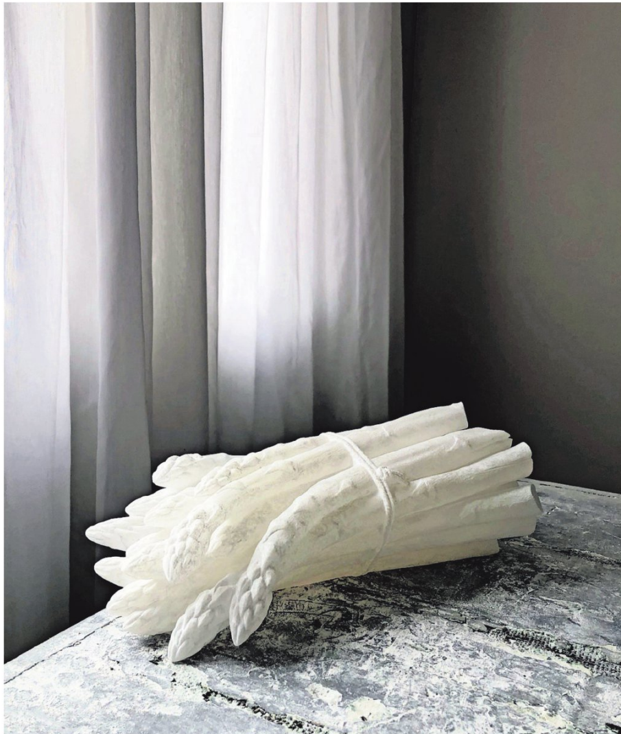
BEELD LYNNE LEEGTE

Galeriehouder Jedithja de Groot kiest een beeld uit het heden en zoekt daar een historische foto bij uit de Collectie Spaarnestad.